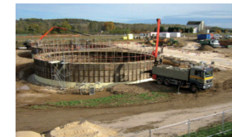
Naskéo construit le même type de projet dans le Loiret. Les besoins sur Brevans sont de l'ordre de 2ha.

cune odeur ou nuisance pour l'entourage." Les délégués ont ensuite validé une proposition d'implantation sur la zone de Brevans, qui a l'avantage d'être traversée par une conduite de gaz sur laquelle l'installation pourra se raccrocher pour la fourniture du biométhane.