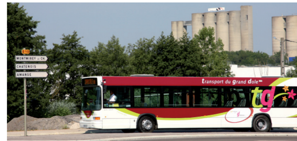
Le nouveau réseau a notamment été pensé pour favoriser les déplacements des salariés