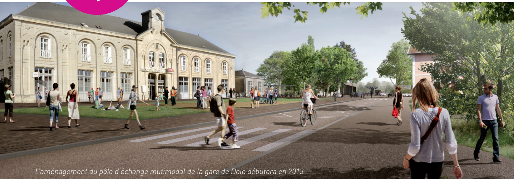
L'aménagement du pôle d'échange multimodal de la gare de Dole débutera en 2013