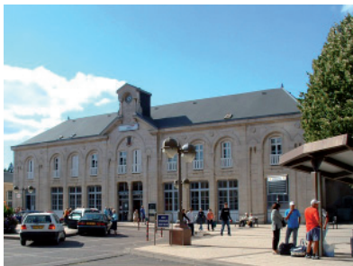
Un budget de 40 000 euros a été inscrit pour une étude d'un projet de gare d'agglomération.

Le conseil a validé les propositions d'investissement pour 2009