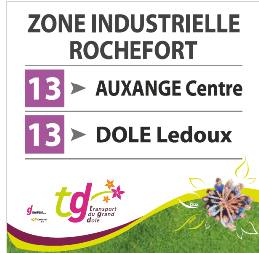
Exemple tête de poteau

GRAND DOLE – Place de l'Europe - 39100 DOLE - info@grand-dole.fr