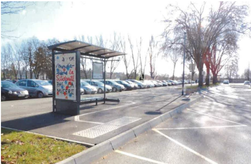
Dole, Stade municipal