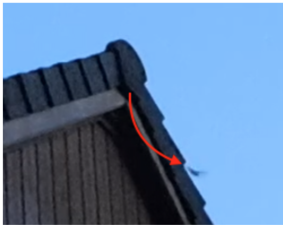
Sortie de gîte d'une chauves-souris par la tuile faîtière