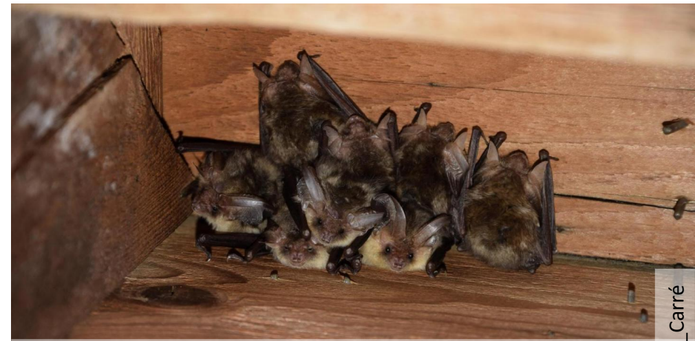
Maternité d'Oueillards roux. Les Oreillards sont caractérisés par leur très grandes oreilles

Par la recherche d'indices de présence et des comptages à la tombée de la nuit, ainsi que par votre témoignage.