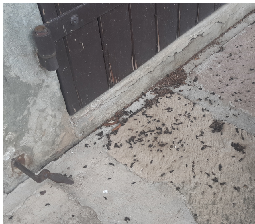
Tas de guano au bas d'un volet