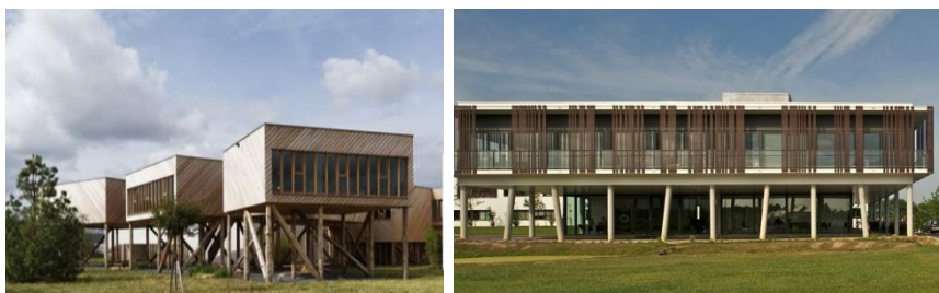
Bureaux sur pilotis, en terrain sensible

La hauteur* du plancher bas est limitée à 6 m maximum par rapport au terrain* naturel pour permettre les constructions* en surplomb (sur pilotis).