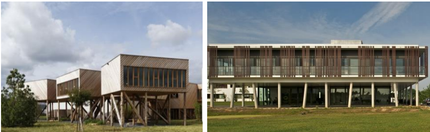
Bureaux sur pilotis, en terrain sensible

La hauteur* du plancher bas est limitée à 6 m maximum par rapport au terrain* naturel pour permettre les constructions* en surplomb (sur pilotis).