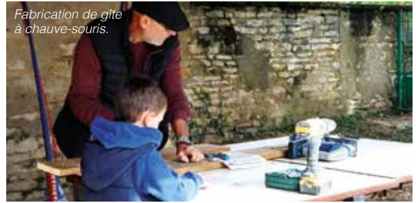
Fabrication de gîte à chauve-souris.

« Le succès des deux dernières éditions, avec la participation nombreuse des Grand Dolois aux manifestations des Semaines du Développement Durable, nous confirme dans l'idée que ce territoire doit prendre sa part dans la transition énergétique et économique de notre pays. Grâce à des ateliers, des visites, des chantiers en lien avec les enjeux de notre territoire (déchets, eau, biodiversité, énergie et climat), nous avons tous l'opportunité de participer et de contribuer à cet élan. »