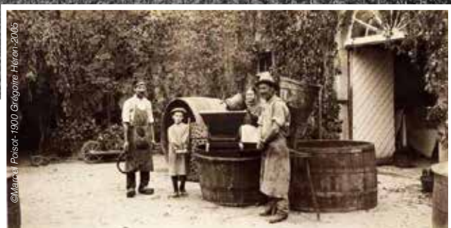
© Marc Poisot - 1900 Grégoire Héron - 2005