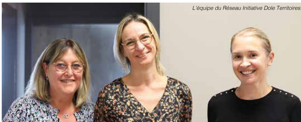
L'équipe du Réseau Initiative Dole Territoires.

Créée en 1986, Initiative Dole Territoires est une association dédiée à l'accompagnement et au soutien des créateurs et repreneurs de petites entreprises, avec une attention particulière pour le secteur industriel. Soutenue par la Communauté d'Agglomération du Grand Dole, l'association propose une gamme complète de services pour aider les entrepreneurs à réussir leur projet.