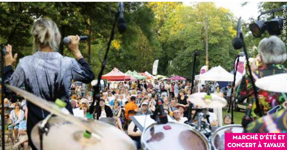
MARCHÉ D'ÉTÉ ET CONCERT À TAVAux