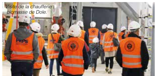
Visite de la chaufferie biomasse de Dole.