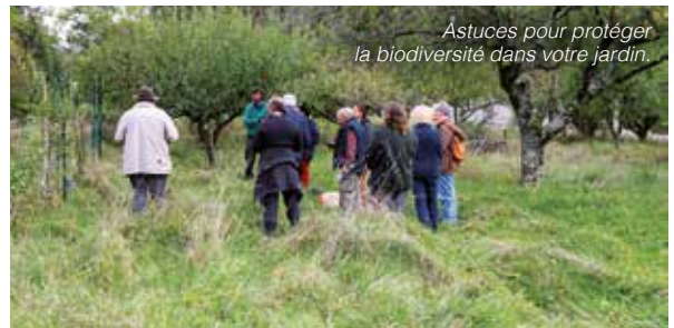
Astuces pour protéger la biodiversité dans votre jardin.