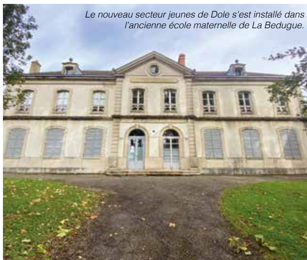
Le nouveau secteur jeunes de Dole s'est installé dans l'ancienne école maternelle de La Bedugue.

Le secteur jeunes de Dole, historiquement installé dans le parc du Château de Crissey et momentanément délocalisé dans le cloître de la médiathèque de l'Hôtel-Dieu, a enfin pris ses nouveaux quartiers.