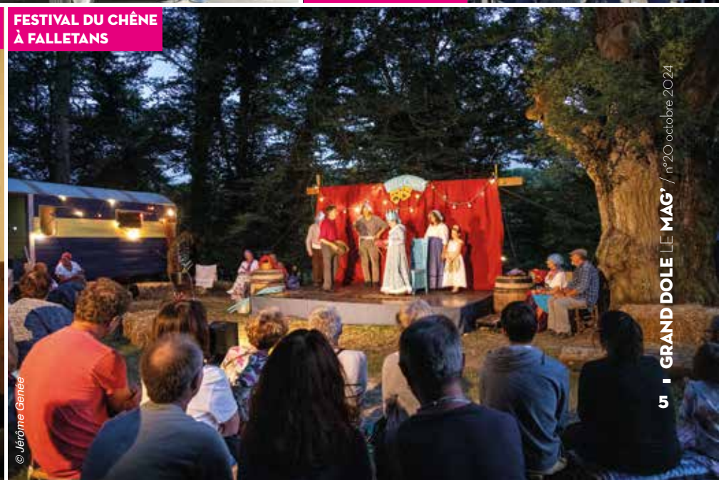
FESTIVAL DU CHÊNE À FALLETANS