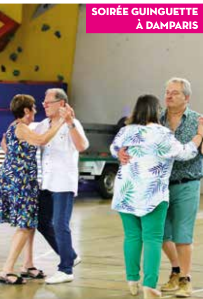
SOIRÉE GUINGUETTE À DAMPARIS

Durant toute la saison estivale, les communes du Grand Dole ont offert aux habitants de l'Agglomération tout un programme d'animations pour vous faire vivre un été convivial, festif et familial ! Retour en images sur quelques événements, qui ont marqué votre été.