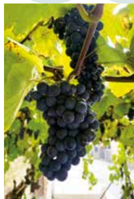
Une grappe de Baco noir. En rosé, il donne un vin agréable avec des arômes de vanille et de pruneau. En rouge, il donne un vin riche en alcool et très coloré.