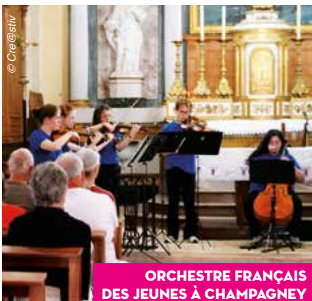
ORCHESTRE FRANÇAIS DES JEUNES À CHAMPAGNEY