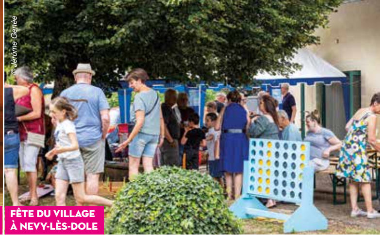
FÊTE DU VILLAGE À NEVY-LÈS-DOLE