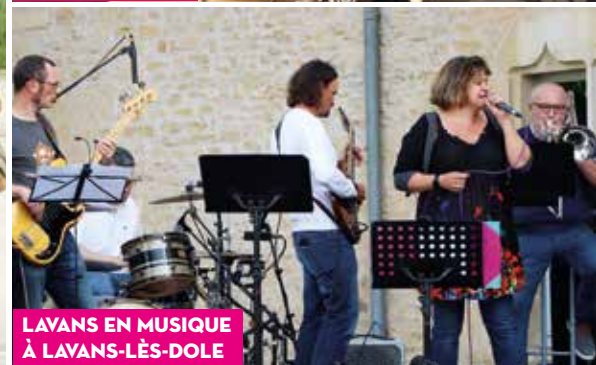
LAVANS EN MUSIQUE À LAVANS-LÈS-DOLE