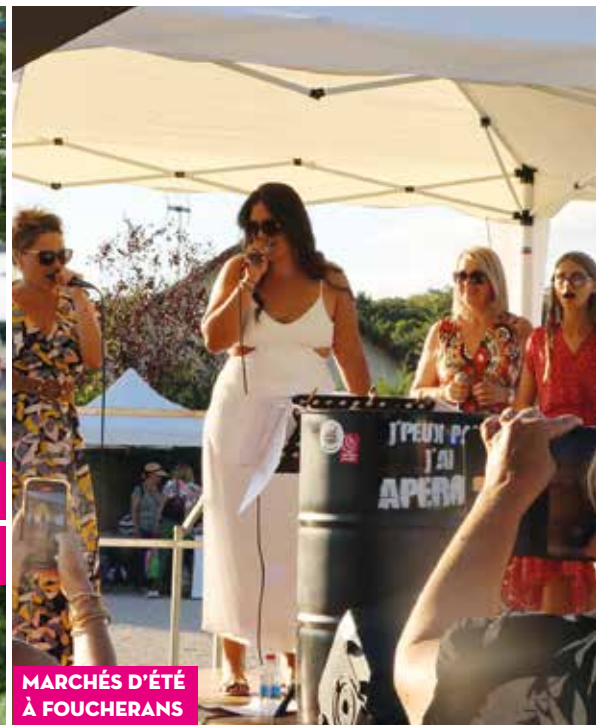
MARCHÉS D'ÉTÉ À FOUCHERANS