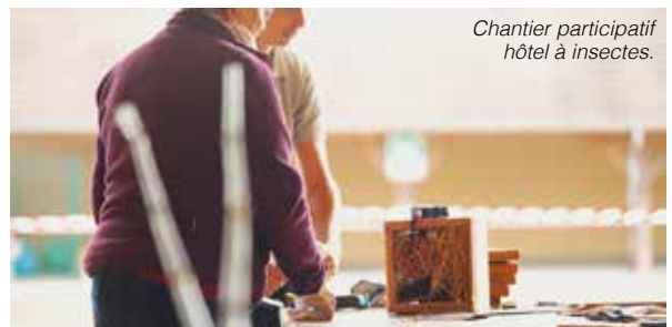
Chantier participatif hôtel à insectes.