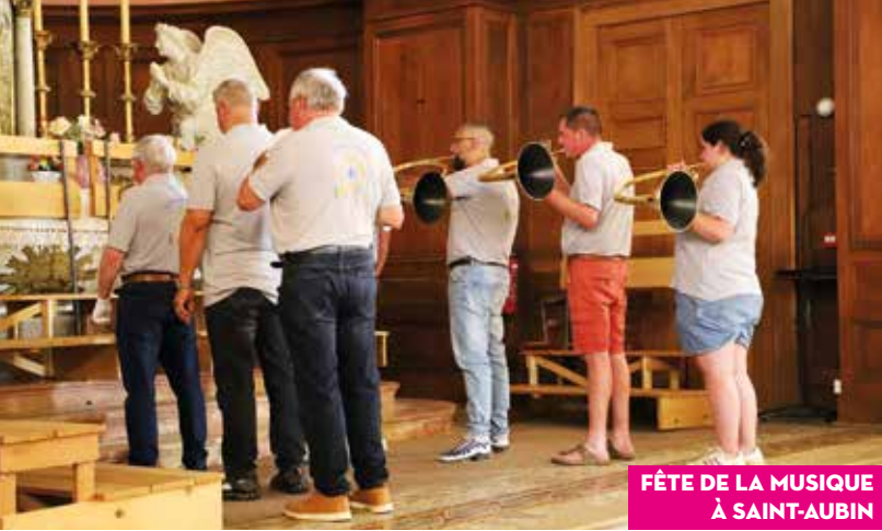
FÊTE DE LA MUSIQUE À SAINT-AUBIN