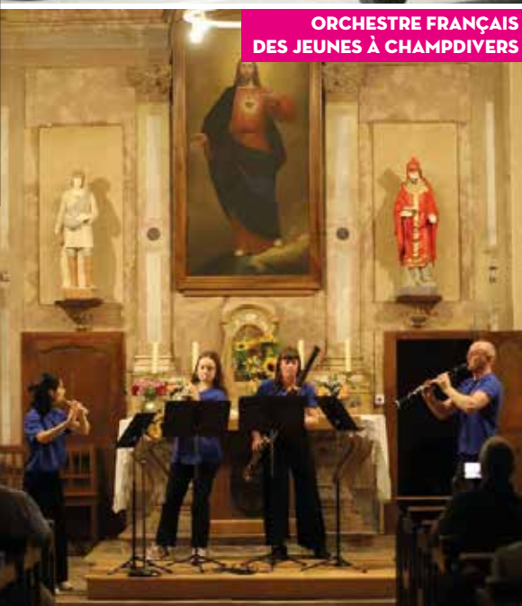
ORCHESTRE FRANÇAIS DES JEUNES À CHAMPDIVERS