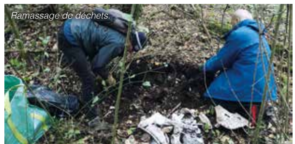
Ramassage de déchets.