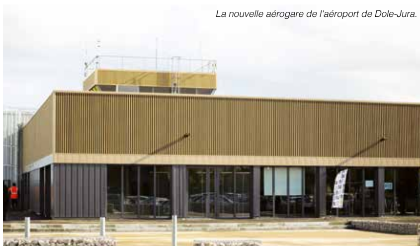
La nouvelle aérogare de l'aéroport de Dole-Jura.