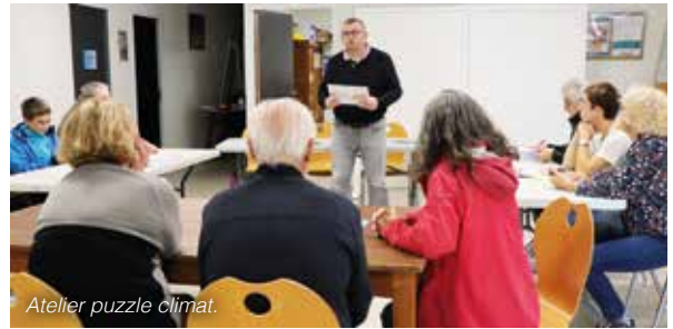
Atelier puzzle climat.