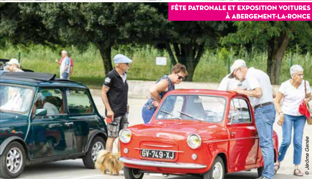
FÊTE PATRONALE ET EXPOSITION VOITURES À ABERGEMENT-LA-RONCE