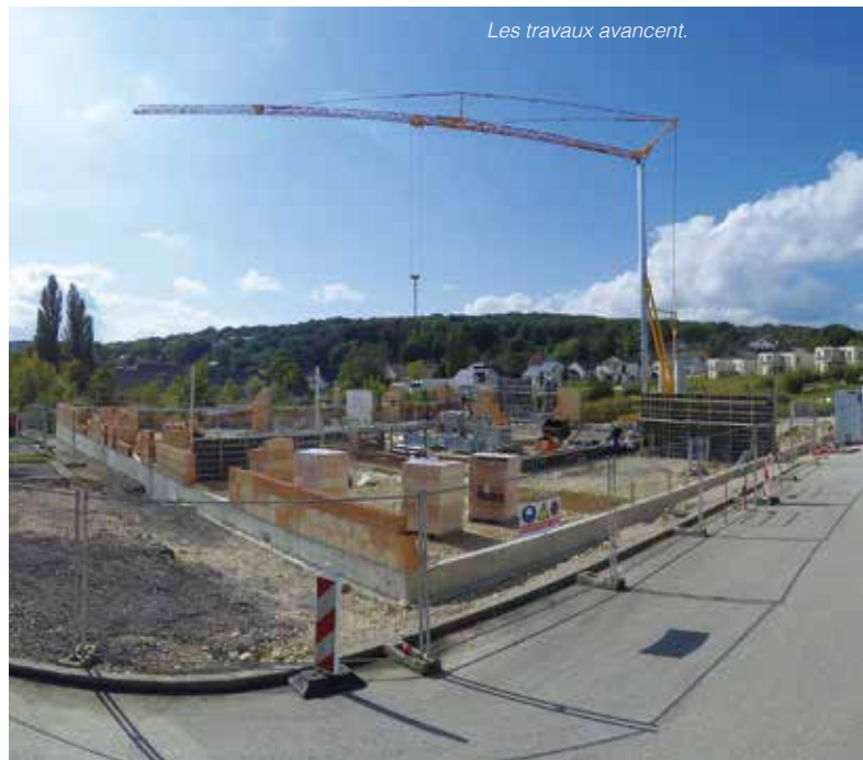
Les travaux avancent.

douches ? », ou encore « Pourquoi autant de fenêtres ? » Ce projet, qui laisse une place importante à la participation des enfants, est très attendu, aussi bien par les élèves, que par le personnel de l'établissement, tous impatients de découvrir ce nouvel espace de vie.